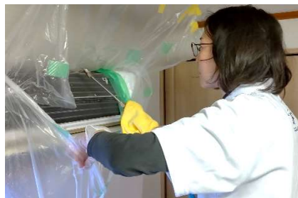
専用洗剤を噴霧して、高圧洗浄機できれいに洗い流します