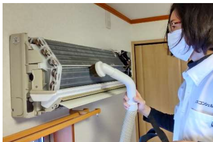
カバーとフィルターを外し、ホコリを吸い取ります

エアコン内部はホコリ、カビの汚れが溜まっています。エアコンクリーニングで綺麗な空気を体感してみてください