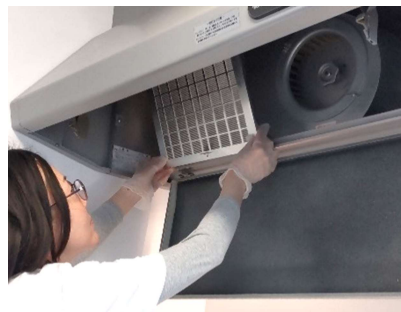
レンジフードのカバーやファンを取り外し、フード内を洗剤でクリーニングします

レンジフード(換気扇)の油汚れはファンを取り外して、つけ置き洗浄できれいにしませんか