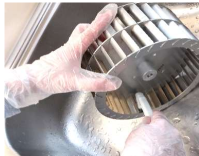
取り外したファンなどをつけ置き、ブラッシングして洗浄します